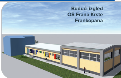
Budući izgled OŠ Frana Krste Frankopana

Izgradnja i rekonstrukcija 15 osnovnih škola Ukupno 2026.-2028. - 51.603.000