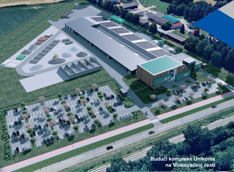
Budući kompleks Unikoma na Vinkovačkoj cesti