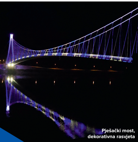
Pješački most, dekorativna rasvjeta