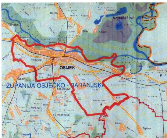
OBUHVAT PROSTORNOG PLANA UREĐENJA GRADA OSIJEK

Inicijativu za nesvrstavanje drvoreda javorolisnih platana uz cestu Josipovac-Osijek u kategoriju spomenika parkovne arhitekture za koji je potrebno preispitati opravdanost pokretanja postupka zaštite nije bilo moguće uvrstiti u Izmjene i dopune PPUGO-a jer je u suprotnosti s Odredbama važećeg Prostornog plana Osječko-baranjske županije.